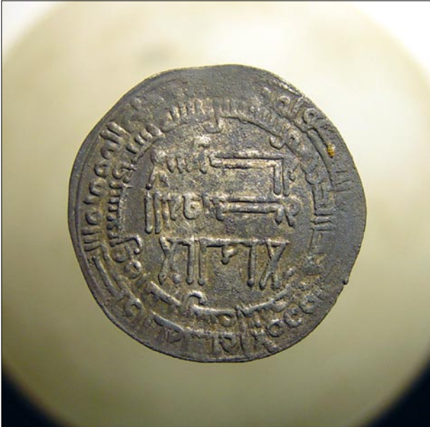
Ett exempel av de arabiska mynten. De flesta var hela och det förekommer relativt få fragment av mynt. Fram- och baksida av samma mynt.

från flera håll på Gotland, bl. a från ödegården Fjäle i Ala socken och från hamnplatsen i Fröjel) och en omböjd silverten.