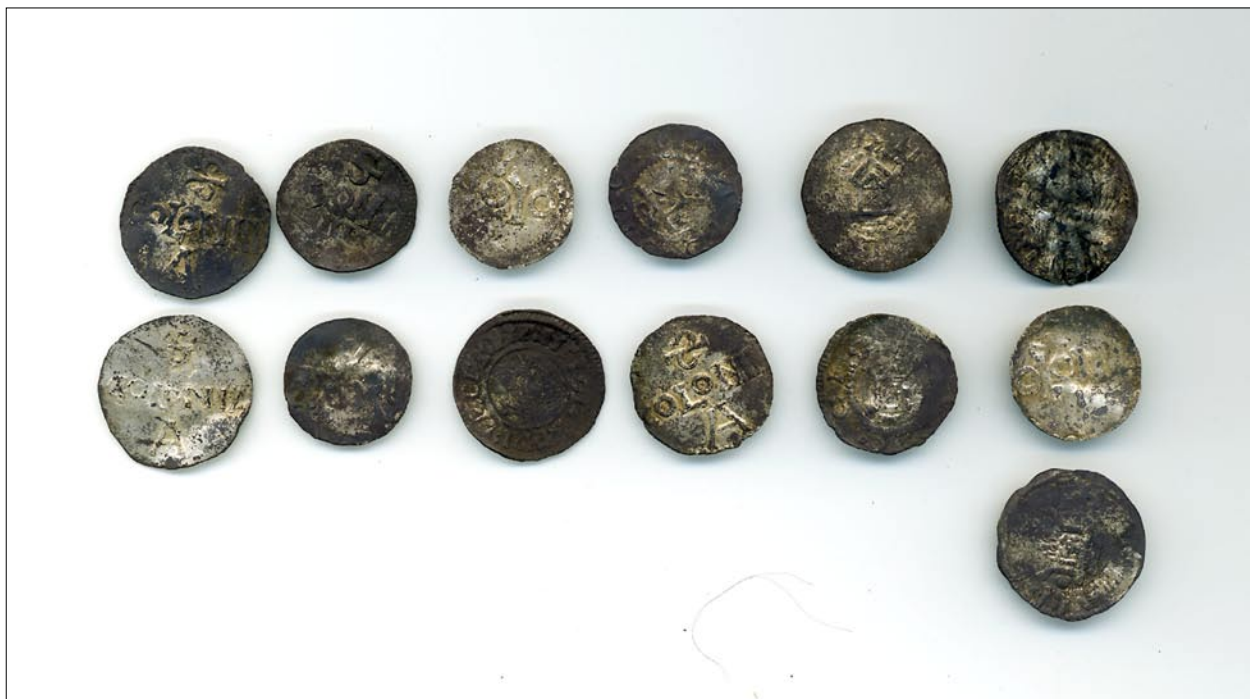
De tyska och engelska mynten från undersökningen 2005. I relation till den föregående undersökningen utgjorde dessa mynt i relation till de arabiska mynten en betydligt större andel. För en beskrivning av mynten, se bilagorna.