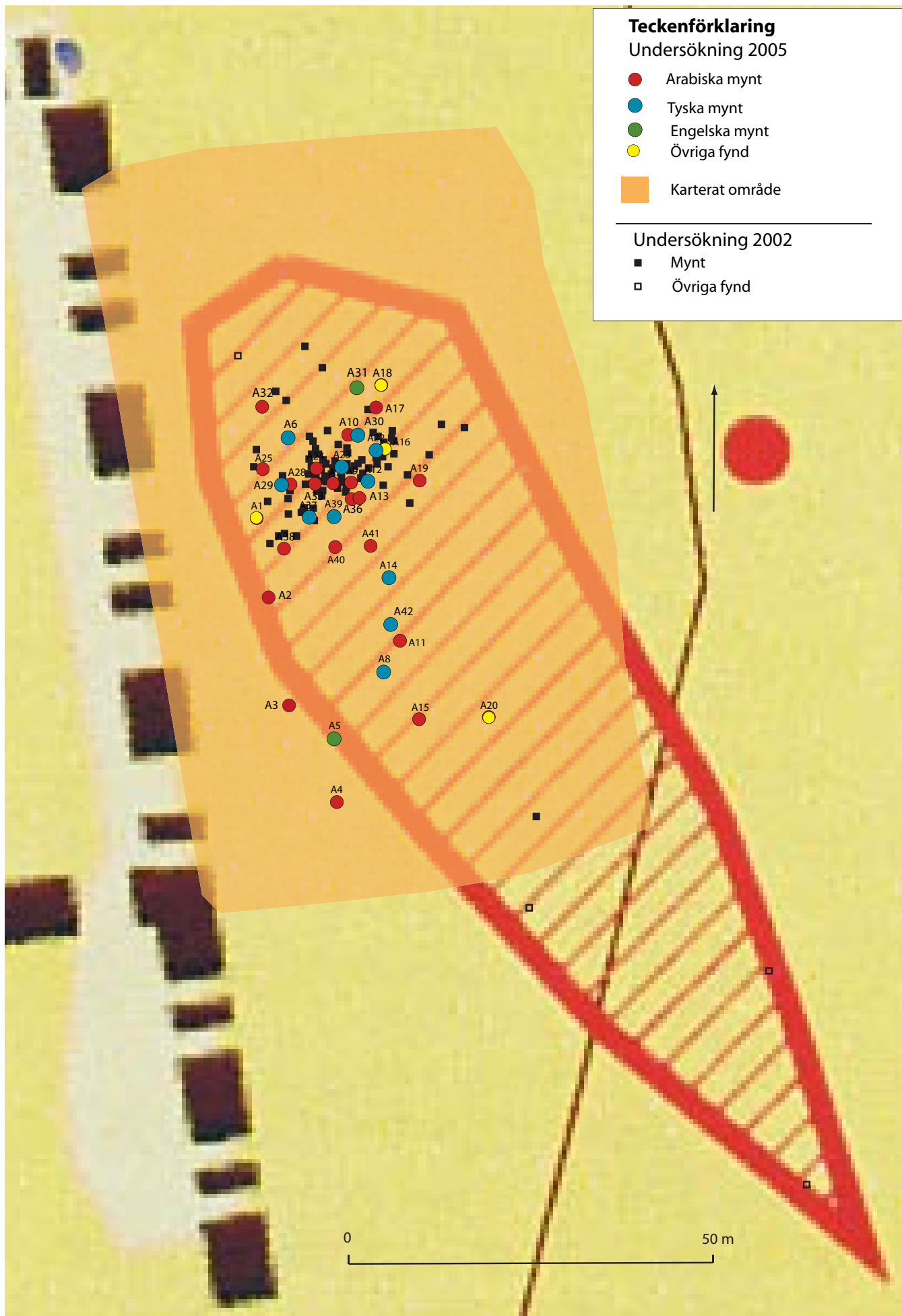
Fördelningen av påträffade föremål 2002 respektive 2005. Man kan notera en god överensstämmelse mellan de två karterings-tillfällena, liksom en klar koncentration av fynden. De enstaka föremålen längst i söder utgör sannolikt grav- eller boplatsfynd.