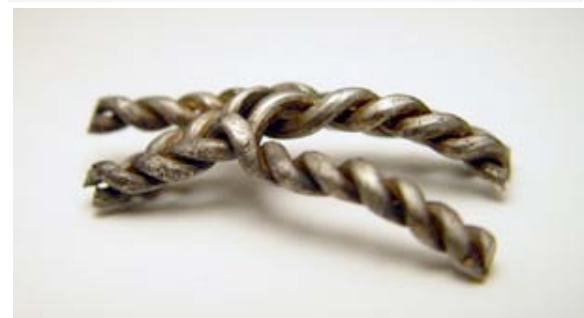
Exmpel på de arabiska mynten från skatt I. Under dessa en del av en ornerad silverarmring, dekorerad med linjer och punkter (ca 4 cm lång) och tvinnade silvertrådar (ca 5 cm långa).