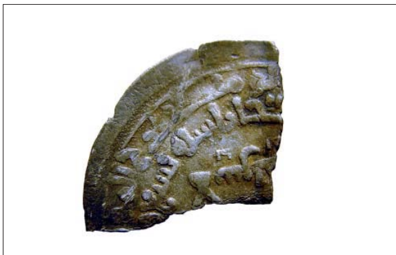
De två arabiska mynten, påträffade i åkerns östra del och sannolikt indikerande platsen för ytterligare en skatt i åkern. Mynten är inte avbildade skalenligt.

meter genomsöktes tämligen noggrant. Härvid påträffades två arabiska mynt; ett i det närmaste helt och ett kvarts mynt. Enligt bestämning av Gert Rispling på Kungl Myntkabinettet utgörs de av följande mynt;