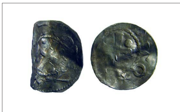
De två tyska mynten (G3 och G4, se fyndbilagan).

Vårt intryck är att skatterna vid det här laget är i det närmaste upplockade, varvid några ytterligare undersökningar knappast kan vara meningsfulla.