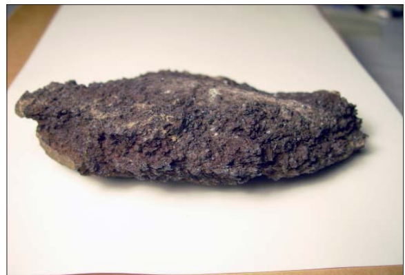
Bottenskälla av järn, sannolikt från en bortplöjd förhistorisk järnugn.

En annan variant kan vara att den plundring