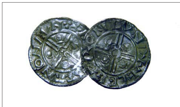
De två engelska mynten (G1 och G7, se fyndbilagan)

De ytor som avsågtes framgår av kartan sidan 6. Som ovan sades koncentrerades undersökningarna till de två kända skattplatserna. Därtill kom ett område mer mot öster och sydöst att avsökas. Inom området för de två skattplatserna påträffades 4 mynt som bör utgöra resterna av de två skatterna (engelska/tyska mynt). Därtill framkom ett par mindre bitar av bly och brons av boplatsskäraktar. Med andra ord var platsen tämligen fyndtom. Förekommande nedgrävda kopparledningarna gjorde dock avsökningen av den centrala delen av skattplatserna svår.