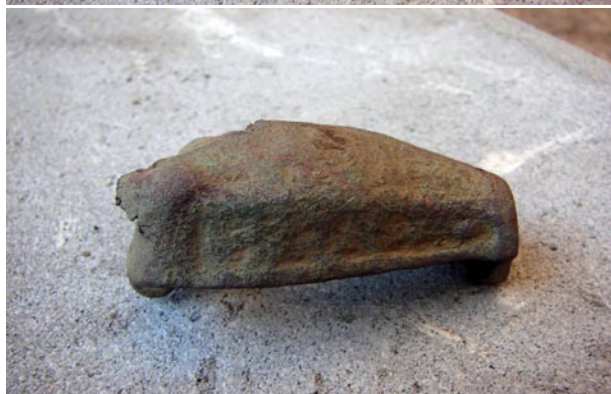
Djurhuvudformat spänne från södra delen av åkern.

Förekomsten av det djurhuvudformade spännets är mer svårklar. Att spännets skulle vara en del av en skatt är inte troligt. Två alternativ förefaller rimliga. Antingen kan det vara resten av en på platsen belägen grav, som genom odlingen har spolierats, i likhet med så många andra vikingatida gravar på Gotland. Det andra alternativet kan handla om att spännets har kommit med i samband med utkörningen av de sentida sopor som finns i den sydligaste delen av åkern. Utan vidare undersökningar är det i dagsläget omöjligt att säga vilket av alternativen som är det mest sannolika eller riktiga. Spännets har inlämnats till läns museet på Gotland.